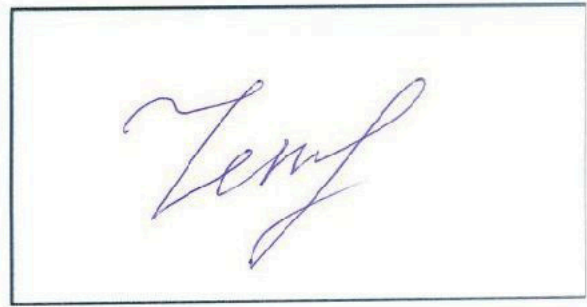
Место для подписи

Примечание: подпись должна иметь четкие, хорошо различимые линии, ставиться черными чернилами, занимать 80% выделенной области и не выходить за пределы рамки.