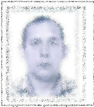
Место для фотографии